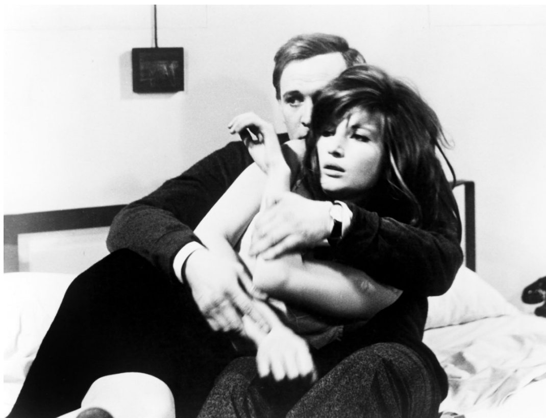
Кадри от филма на Антониони „Червената пустиня“ (1964) с Моника Вити