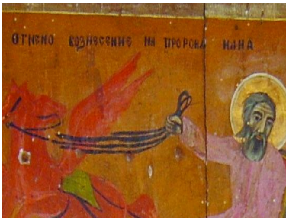
Икона с кирилски надпис от църква в българско село в Западна Тракия.